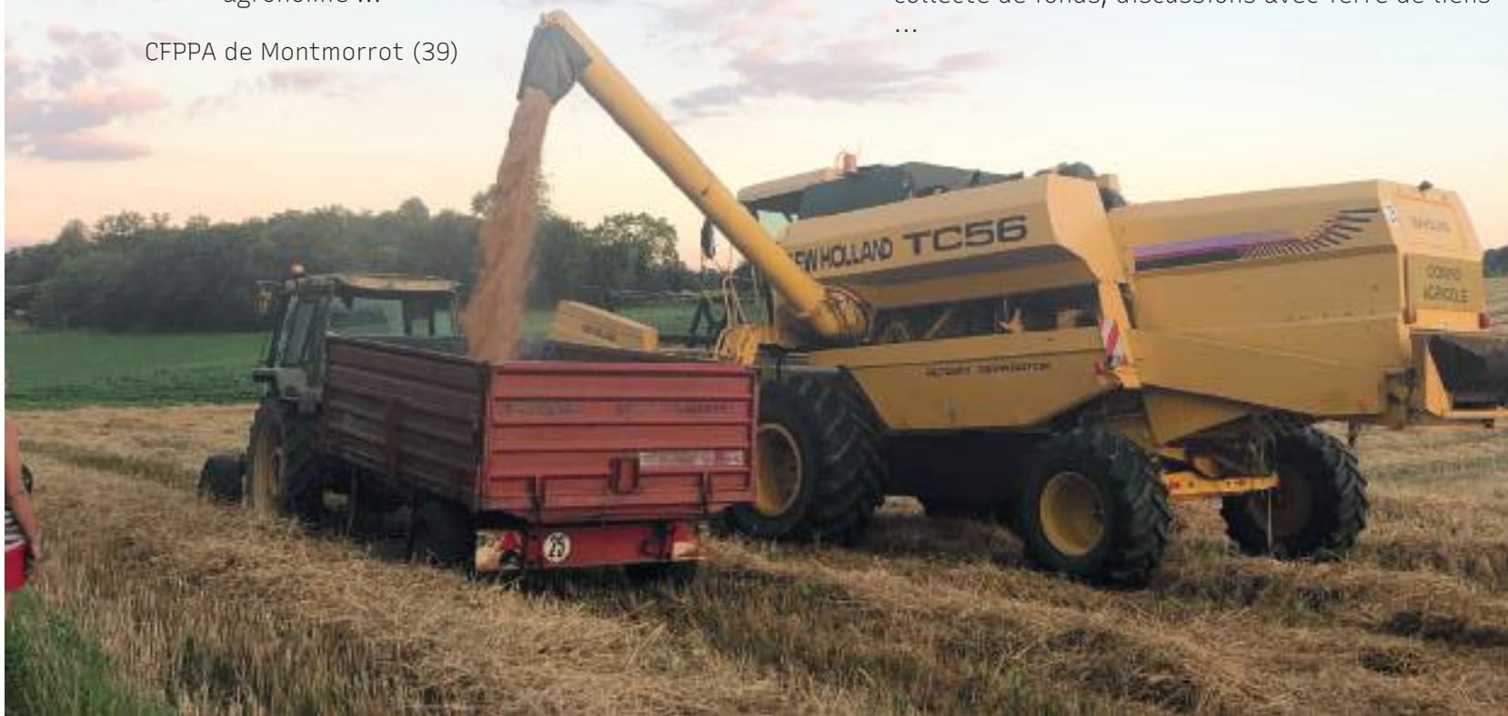
Été 2020 notre toute première moisson !

ON COMMENCE À RÉFLÉCHIR À UN PROJET DE FERME